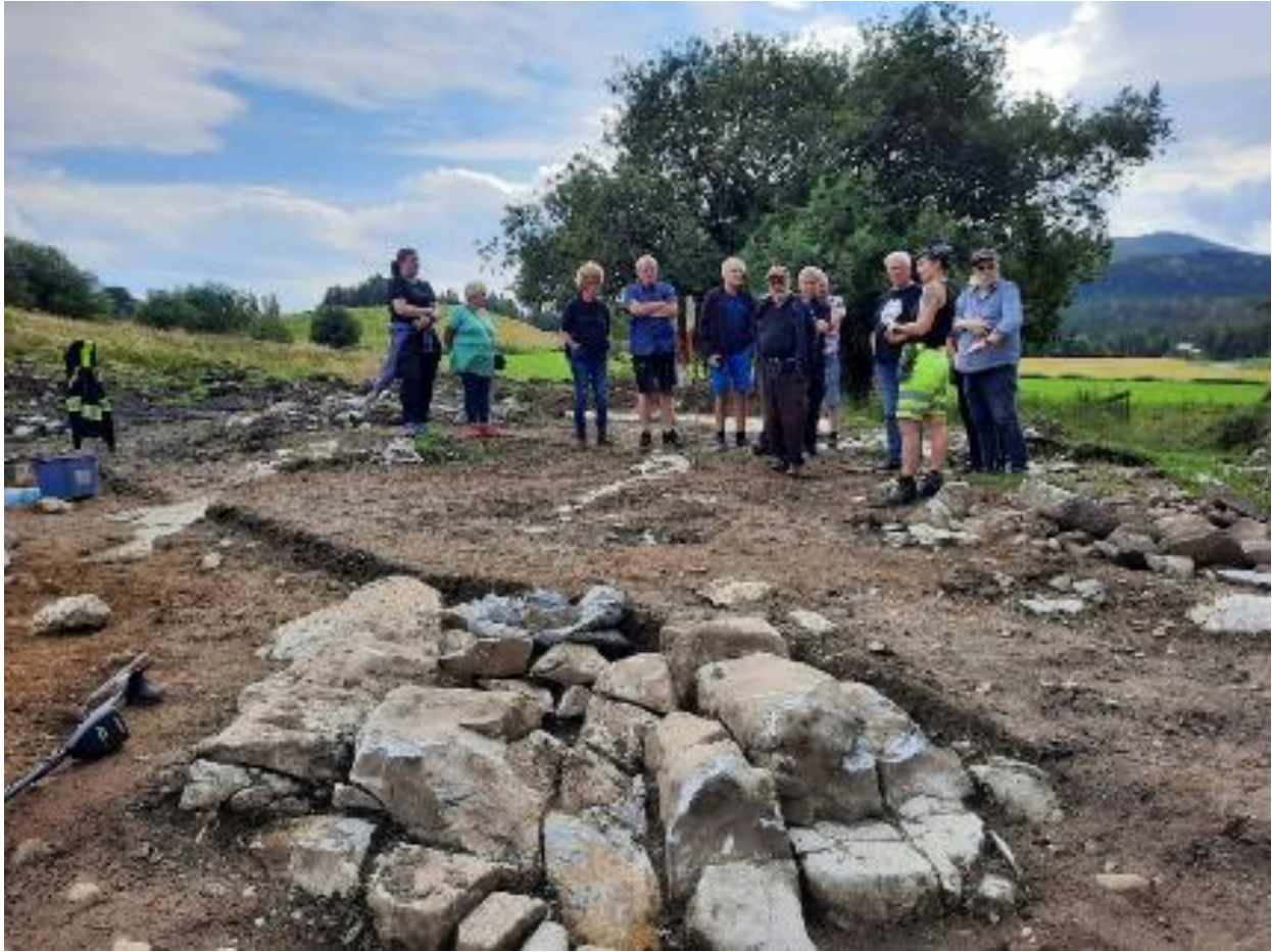
Fra utgravingene i Tromsdalen 2022.