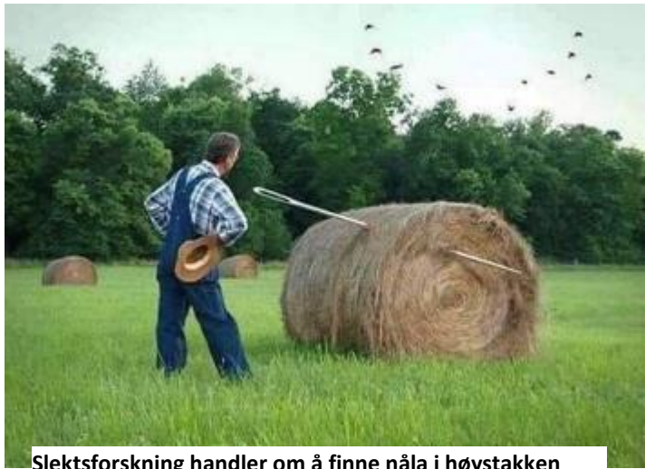
Slektsforskning handler om å finne nåla i høystakken

Det ble holdt kurs utpå høsten med 6 deltakere over 4 kvelder. Hovedfokus var bruk av digitalarkivet. Kildekritikk, og å vurdere om det er riktige opplysninger en er kommet fram til. Og å få lagt inn opplysningene i det slektsprogrammet en jobber med. Kursdeltakerne kom selv med oppgaver som skulle løses.