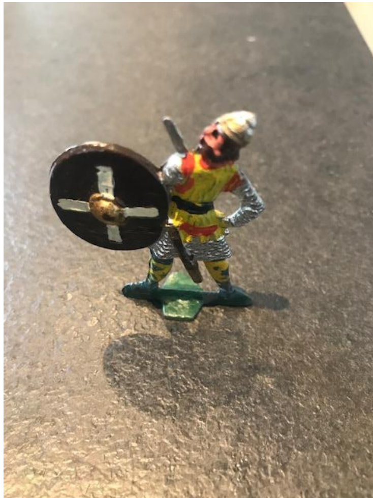
Stolt kriger fra 1930!

Prosjektgruppen er også meget interessert i innspill fra både medlemmer og lokalbefolkningen ellers om sagn, anekdoter og hendelser som kan knyttes til den lokale Olavshistorien.