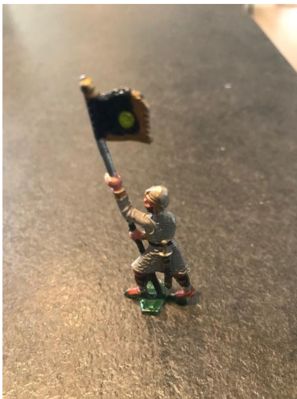
Har ikke funnet merkesmannen enda blant døde i Verdal!

Materialet finnes her: http://verdalsportalen.no/DodeVerdalPub.php og oppdateres stort sett daglig, med både gammelt og nytt.